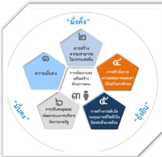
ความเชื่อมโยงของยุทธศาสตร์ชาติกับแผนในระดับต่างๆ

การจัดทำแผนพัฒนาท้องถิ่นสี่ปีของ อบต. มีความสัมพันธ์กับแผนยุทธศาสตร์ชาติ ๒๐ ปีโดยมุ่งเน้นเพื่อขับเคลื่อนการพัฒนาประเทศไปสู่ความมั่นคง มั่งคั่ง และยั่งยืน โดยแผนยุทธศาสตร์ชาติ ๒๐ ปี ของประเทศไทยกำลังอยู่ระหว่างการเสนอร่างกรอบยุทธศาสตร์ชาติต่อที่ประชุมคณะกรรมการจัดทำยุทธศาสตร์ชาติ ซึ่งขณะนี้อยู่ระหว่างการดำเนินการปรับปรุงร่างกรอบยุทธศาสตร์ชาติตามมติที่ประชุมคณะกรรมการจัดทำร่างยุทธศาสตร์ชาติ โดยร่างกรอบยุทธศาสตร์ชาติ ๒๐ ปี(พ.ศ. ๒๕๖๐ – ๒๕๗๙) สรุปย่อได้ ดังนี้